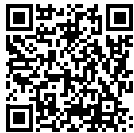
Film HEINE DELTA 20T