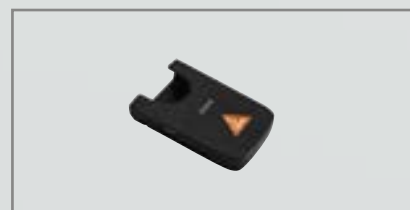
Etui do ładowania CC1 [02]