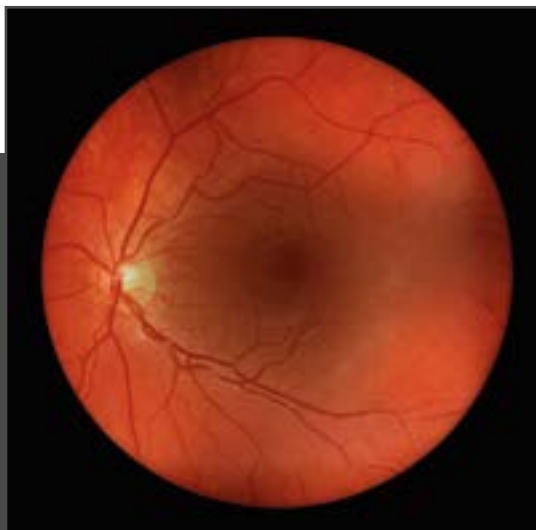
Obraz siatkówki poprzez zaćmę z visionBOOST*