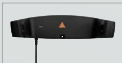
Ładowarka ścienna CW1 [05]