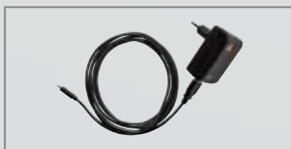
Ładowarka E4-USBC [04]